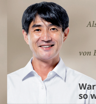
Prof. Akira T. Palliativmediziner

Die „Charta zur Betreuung schwerstkranker und sterbender Menschen in Deutschland“ setzt sich für Menschen ein, die aufgrund einer fortschreitenden, lebensbegrenzenden Erkrankung mit dem Sterben und dem Tod konfrontiert sind.